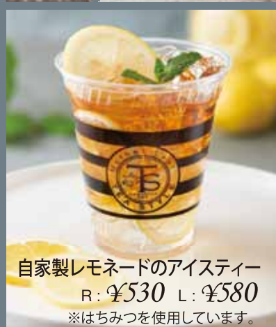
自家製レモネードのアイスティー R: ¥530 L: ¥580 ※はちみつを使用しています。