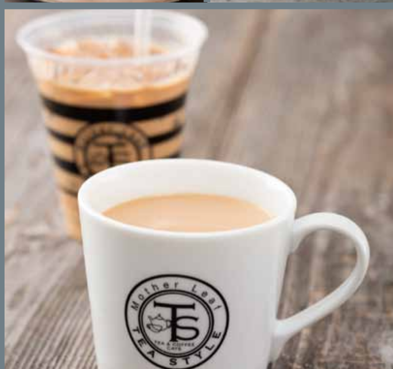
ロイヤルミルクティー(ホット/アイス) ¥490