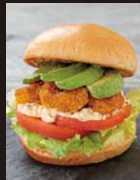
エビとアボカドの サンド