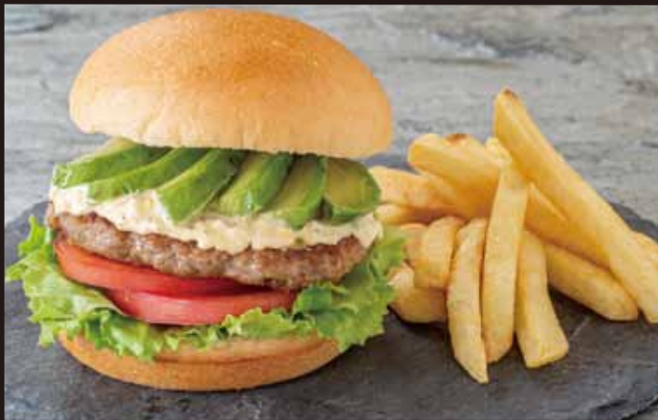
和牛バーガー アボカドわさび