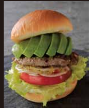
アボカドバーガー