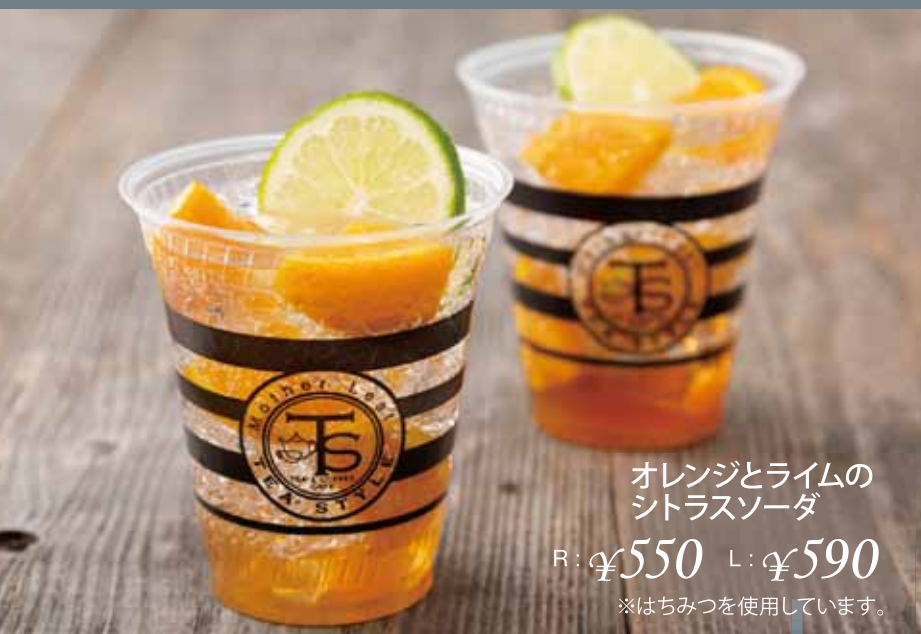
オレンジとライムの シトラスソーダ R: ¥550 L: ¥590 ※はちみつを使用しています。

※表示価格は税込みです。 ※写真はイメージです。 ※カフェインは0.01g(100g当たり)未満をノンカフェインとしています。