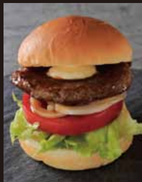
テリヤキバーガー