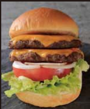
ダブルチーズバーガー