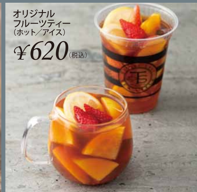
オリジナル フルーツティー (ホット/アイス) ¥620 (税込)