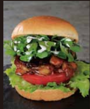
テリヤキチキン サンド