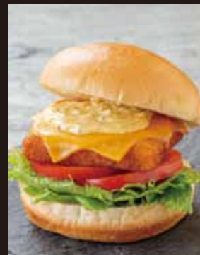
自家製タルタルの フィッシュサンド