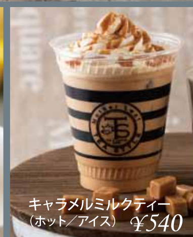
キャラメルミルクティー (ホット/アイス) ¥540