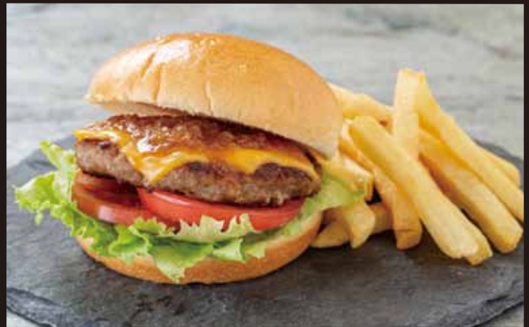
和牛バーガー シャリアピンソース