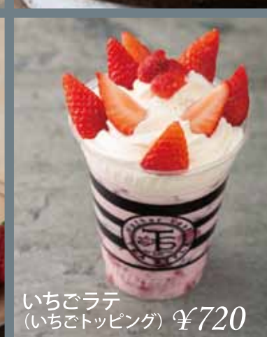
いちごラテ (いちごトッピング) ¥720