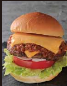
HOT チリチーズ バーガー