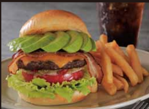
アボカドベーコン チーズバーガー