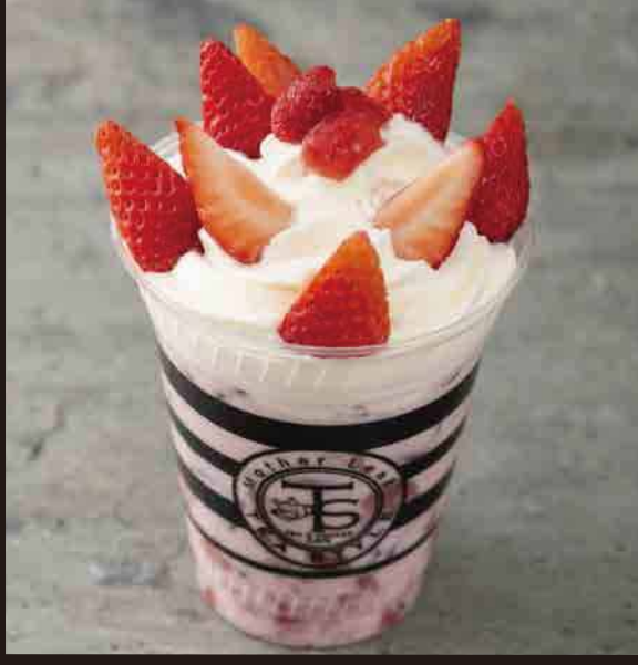
いちごラテ (いちごトッピング) ¥720