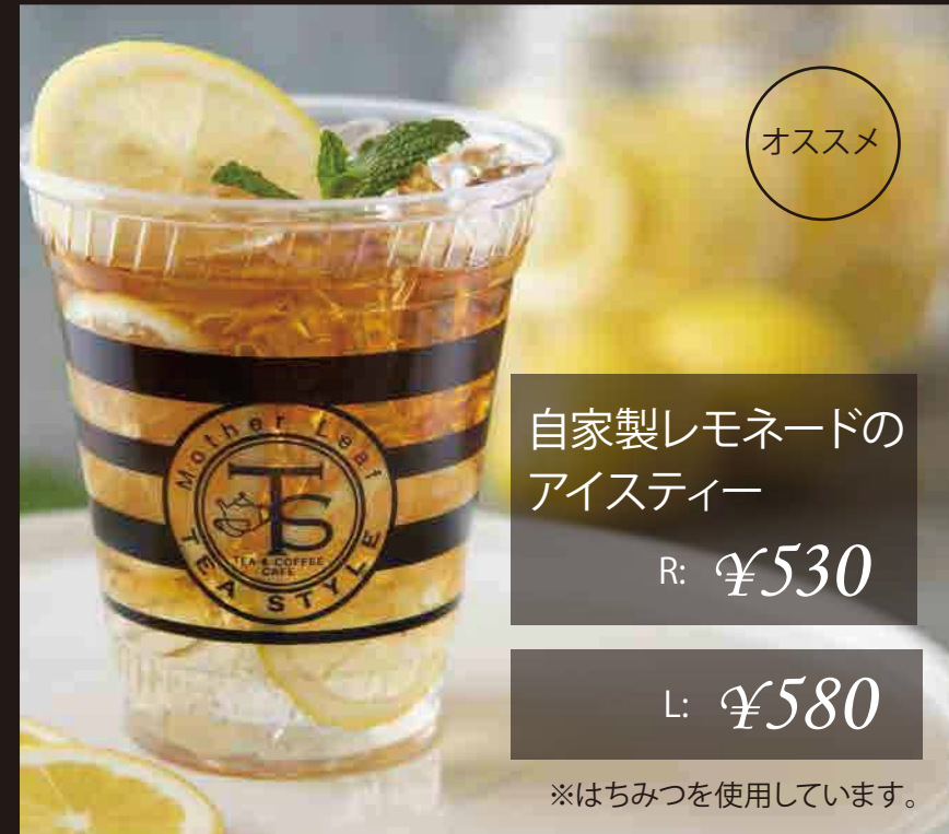
自家製レモネードのアイ스티ー R: ¥530 L: ¥580