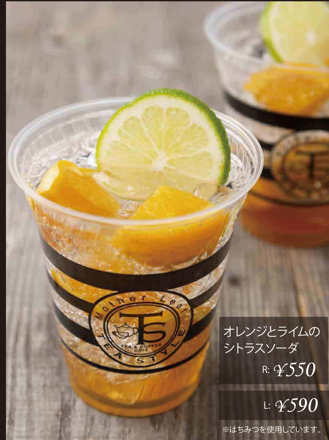
オレンジとライムのシトラスソーダ R: ¥550 L: ¥590