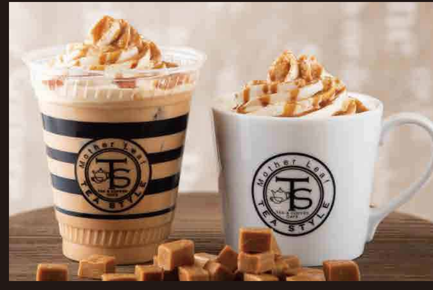
キャラメルミルクティー (ホット・アイス) ¥540