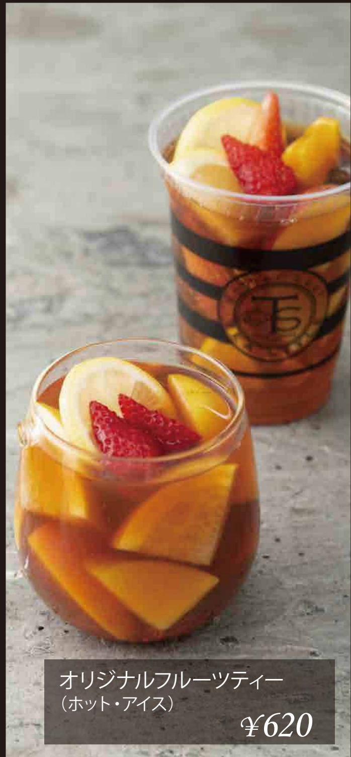
オリジナルフルーツティー (ホット・アイス) ¥620